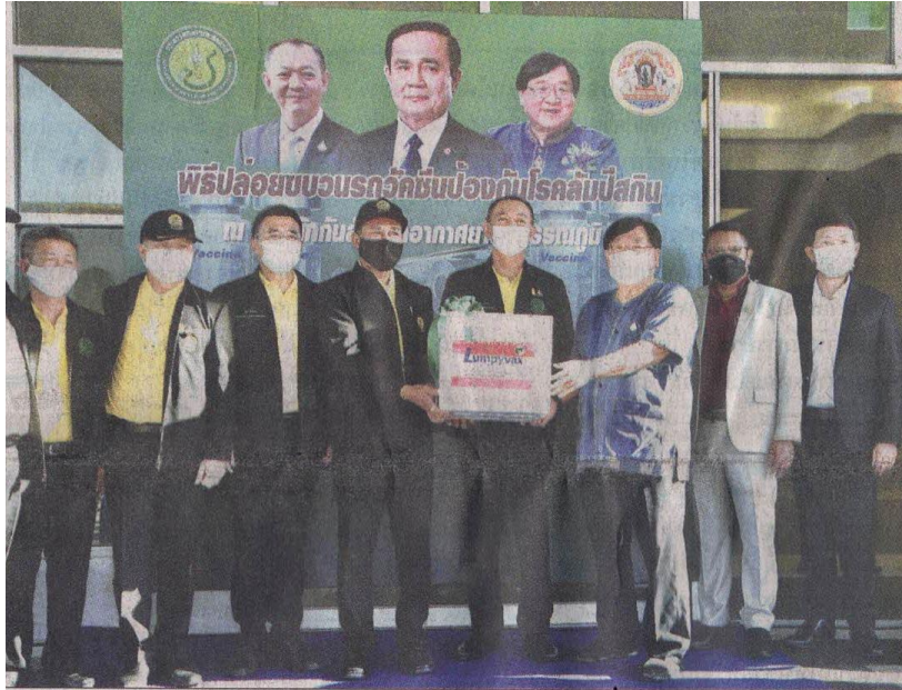
▲ วัคซีน : ดร.เฉลิมชัย ศรีอ่อน รมว.เกษตรและสหกรณ์ วัคซีนโรคโควิด สกีน ลอตแรก จำนวน 60,000 โดส จากประเทศเนเธอร์แลนด์ เพื่อใช้ควบคุมโรคโควิด สกีน โรคอุบัติใหม่ในโค-กระบือ ซึ่งกำลังระบาดในประเทศไทย ที่ด่านกักกันสัตว์ท่าอากาศยานสุวรรณภูมิ จ.สมุทรปราการ

ข่าวประจำวันจันทร์ที่ ๓๑ พฤษภาคม ๒๕๖๔ หน้าที่ ๑